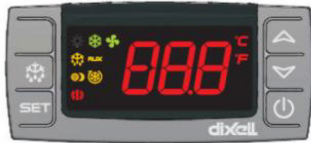
Ovládací panel Dixell (obr. 2)